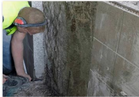
Travaux de génie civil