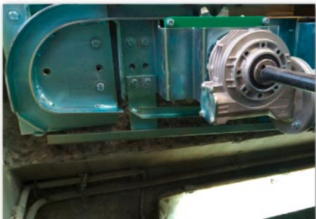
Fixation du guide de stockage