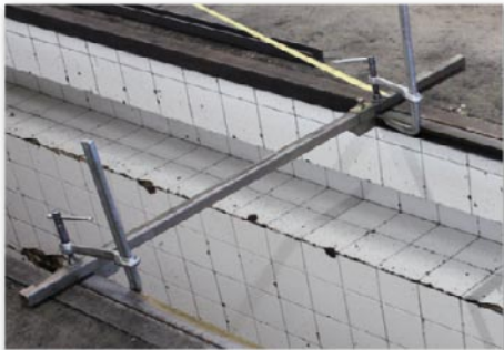
Fixation du chemin de roulement