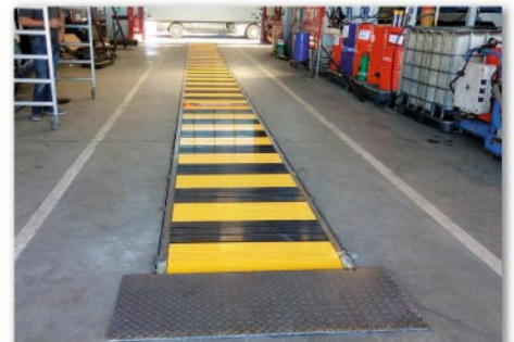
La couverture de fosse est installée