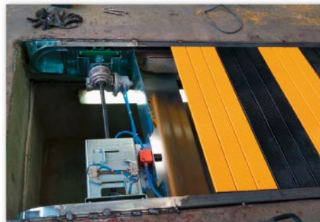
Mise en place de la couverture de fosse