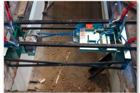
Installation du moteur