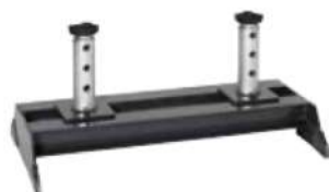
AB Traverse de calage 20 €

Idéal pour les centres de contrôle technique. Réglage simple et précis des selles de levage depuis la fosse