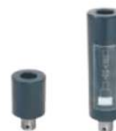
FG100 / FG200 Rallonge 10 €

Essentiel pour le levage sous différents profils d'essieux (en V) et le levage de différents profils de châssis (en U)