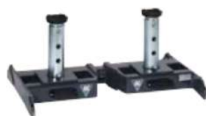
ABT Traverse de calage FLEXIBLE 15 €

Une combinaison parfaite de sécurité et de flexibilité. Le châssis ouvert permet une mobilité de traversée optimale