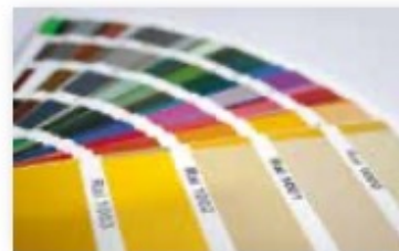
Couleur de la couverture au choix parmi les RAL standards