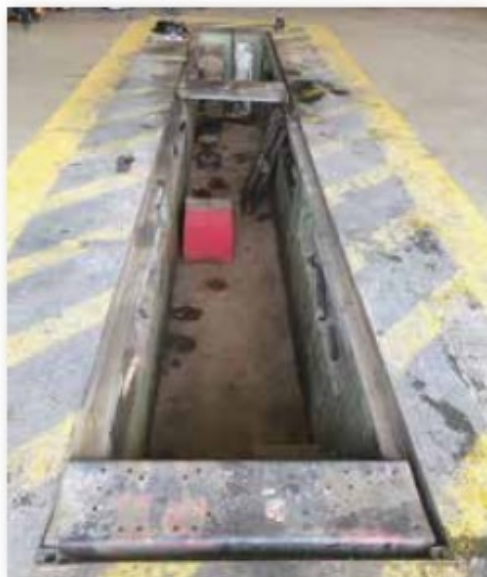
Fosse avant sécurisation