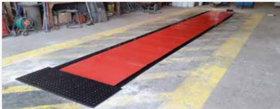
Fosse après sécurisation

Une gamme complète de solutions permettant de nous adapter à tout profil de fosse en construction ou en rénovation