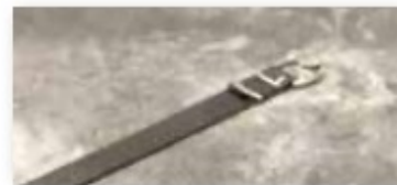
Verrouillage au sol Piton escamotable