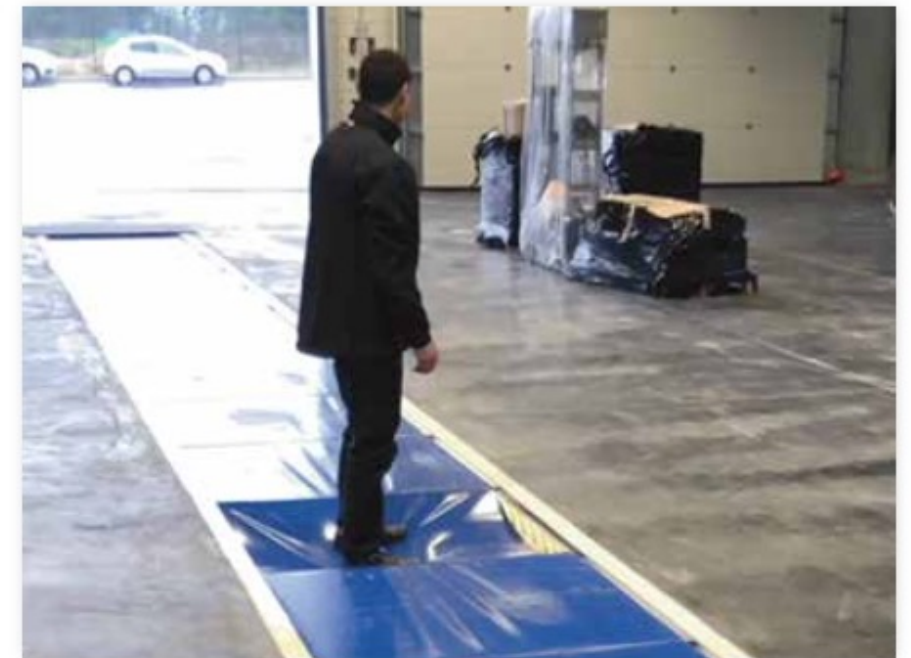
Dispositif non piéton mais résistant au poids d'un homme

>> Empêche l'écrasement du rail lors du passage de roues jumelées