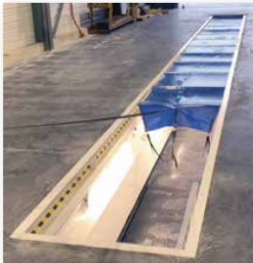
Fermeture à l'aide d'une sangle. Rapide : 16 m en 20 secondes