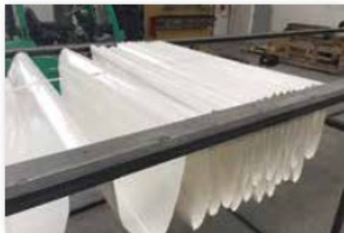
Stockage en lés pour un encombrement minimum

Notre système breveté est un dispositif anti chute qui coulisse sur votre rail bord de fosse à l'aide de tubes en aluminium équipés de roulements sur des axes usinés pour une mise en place rapide et sans aucun effort